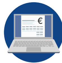
Votre logiciel de comptabilité EBP